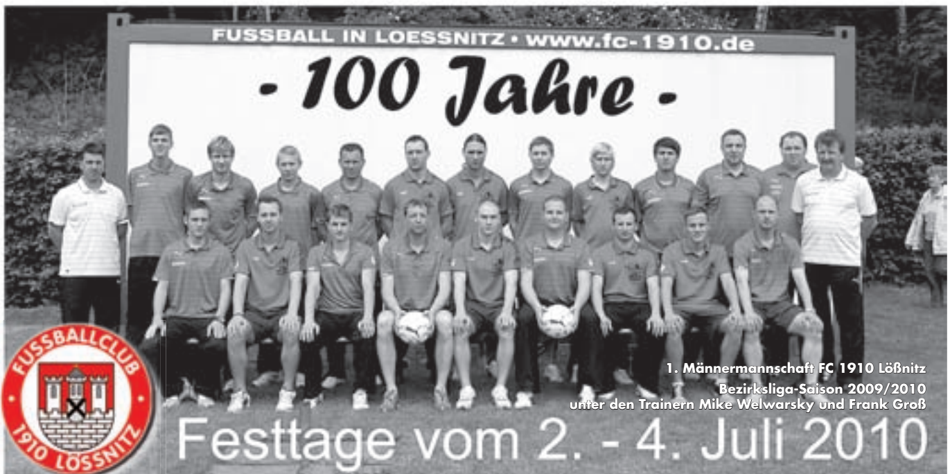
1. Männermannschaft FC 1910 Löbnitz

Für den amtlichen Teil ist der Bürgermeister der Stadt Löbnitz, Herr Gotthard Troll, verantwortlich. Redaktion für Textteil: Stadtverwaltung Löbnitz u. Herr Göppert Anzeigenteil: Stadtverwaltung · Konzept/Gestaltung: WVD Aue · Druck: Druckerei & Verlag Mike Rockstroh, Aue